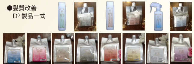
●髪質改善 D 3 製品一式